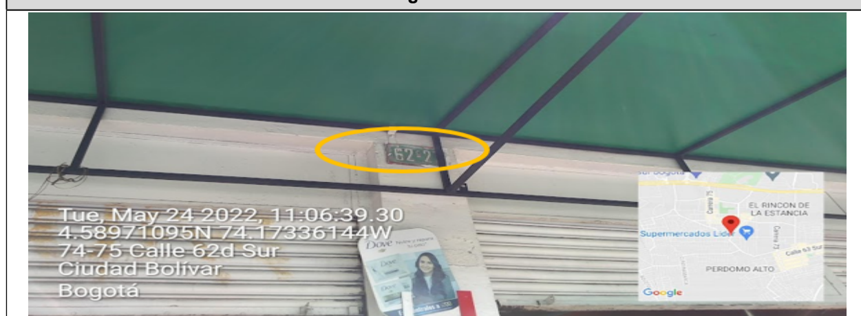
Fotografía No. 1

Nomenclatura del predio donde se sitúa el establecimiento comercial denominado PANADERÍA PASTELERÍA ESTRELLA DORADA ubicado en la TV 73 B No. 62 C – 27 Sur .